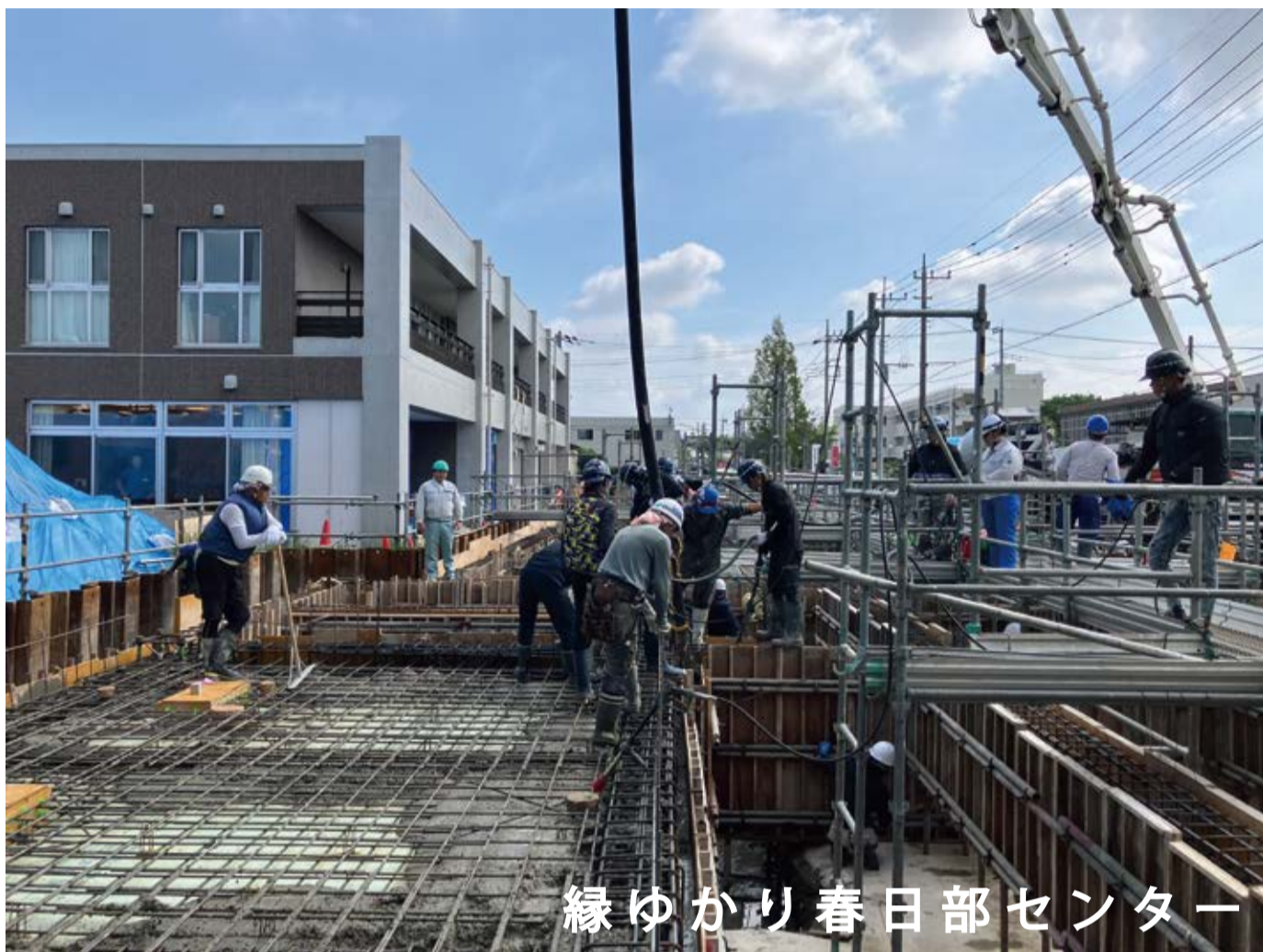
縁ゆかり春日部センター

昨今の建設業界は職人不足や、職人の高齢化、労働時間の短縮などから工期が長くなり、価格高騰にもつながるといわれていますが、さまざまな問題を解決しながら工事は進んでいきます。なかなか先の読みにくい状況ですが、こうした時代でも物づくりの職人さんたちは頑張ってくれています。いよいよこちらの現場も9月末にはこの上部に鉄骨のフレームが立ち上がってきます。仕上げ材の最終確認や細かい機能的な要素を議論しながら現場は進んでいきます。春日部市の伝統工芸でもある桐箱の桐材をうまくアレンジしながら、外部には藤棚のある散策路を設け、地域の方々が気軽に立ち寄れる場所になればと考えています。来年早々のオープンに向けて今から完成が楽しみです。