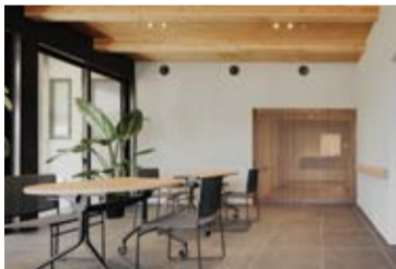
02. エントランスホール

福井県敦賀市の田園風景にたたずむ高齢者グループホームです。9人×2ユニット・18床と小規模で、利用者の個室からは畑や大自然を望むことができます。木造平屋とすることで、木質感を感じられるあたたかいしつらえとしています。地域の方々が気軽に立ち寄れる芝生の広場では、小学校帰りの子ども達の遊び場となっており、いつも賑わっています。それぞれの生活スタイルを尊重し、多世代が交流できる笑顔あふれる高齢者施設です。