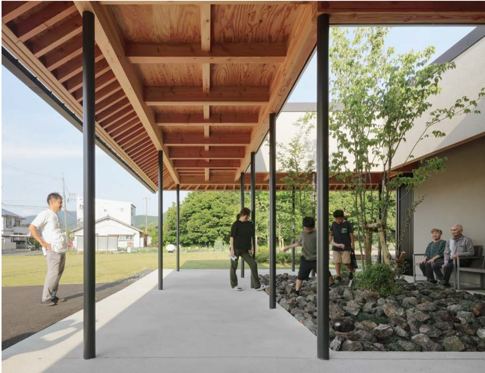
01. エントランスとテラス